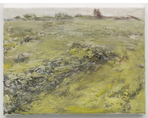
Z.t. • 2017 • olieverf op linnen • 30 x 40 cm