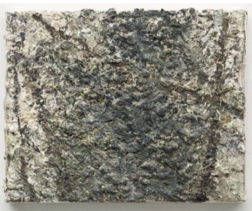
Z.t. • 2017 • olieverf op linnen • 20 x 25 cm

Stationsweg 66 8401 DS Gorredijk 0513 465178 info@galeriehoogenbosch.nl www.galeriehoogenbosch.nl