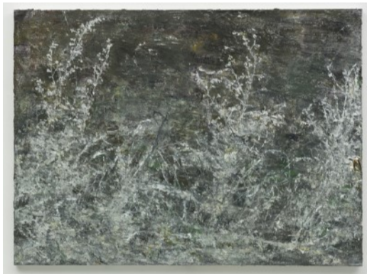
Z.t. • 2017 • olieverf op linnen • 57 x 95 cm