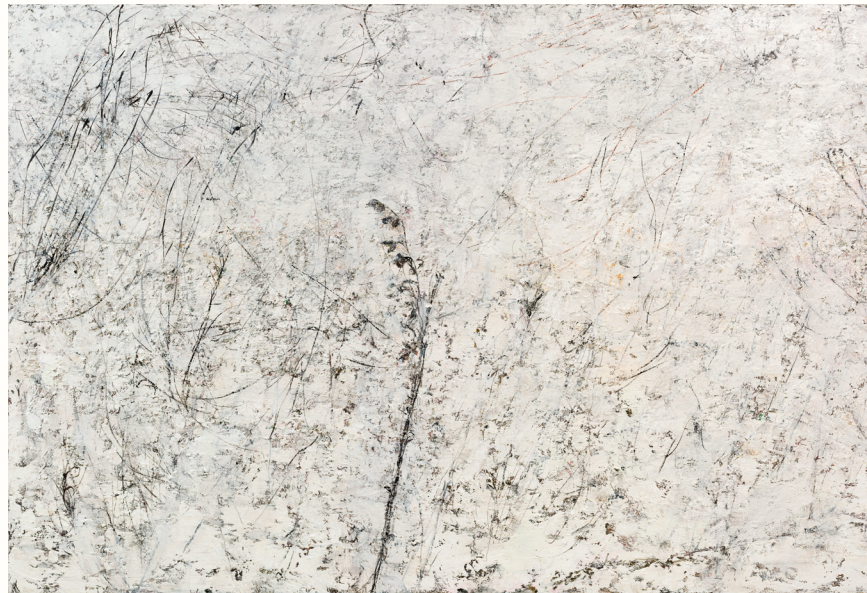
olieverf op linnen, 2014