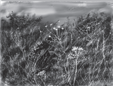
tablet tekening op kozo papier, 2014